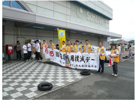
ダメ。ゼッタイ普及運動