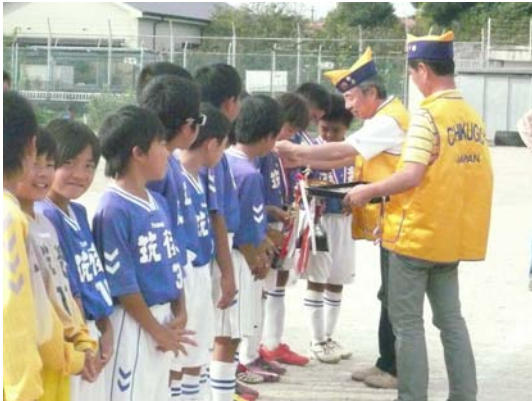
筑後LC杯少年サッカー大会