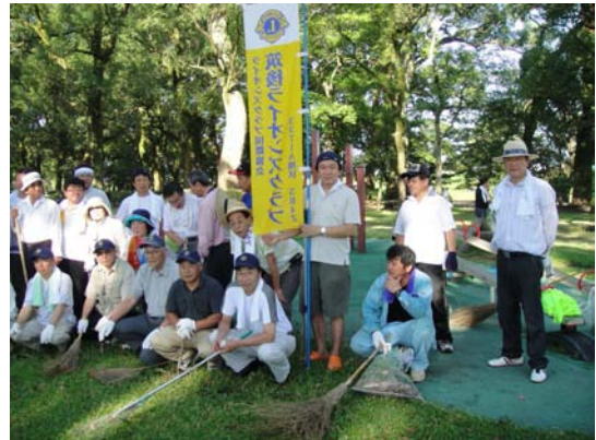
中ノ島公園・瀬高クラブとの合同清掃