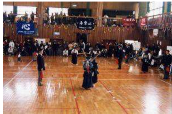
LC 旗争奪市内少年剣道大会