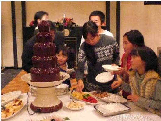
クリスマス家族例会 レディ・お孫さんも参加で楽しいひとときを過ごします