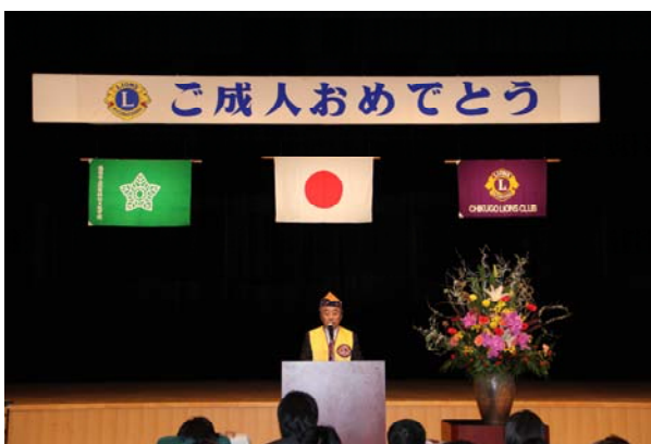
筑後養護学校卒業生の成人を祝う会 毎年多くの感動を受ける事ができます