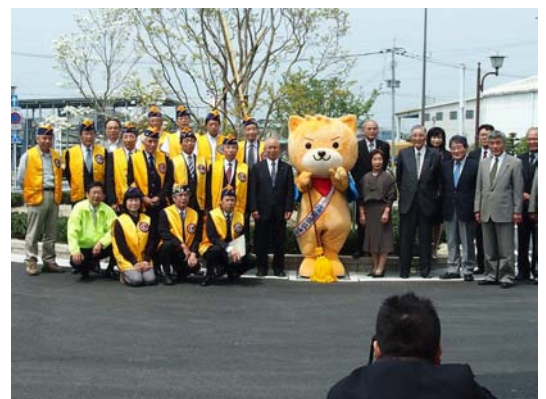
JR羽犬塚駅西口に記念植樹 「ライオンズガーデン」